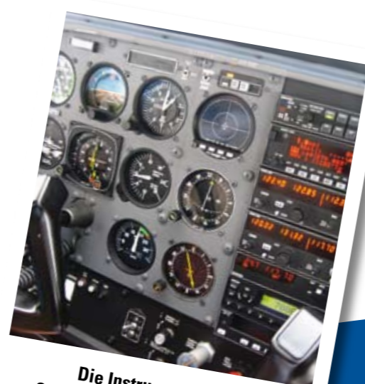
Die Instrumente des Charterflugzeugs Cessna 172 R