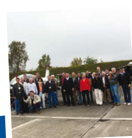
Trainees und Fluglehrer des 11. AOPA-Trainingscamps in Stendal