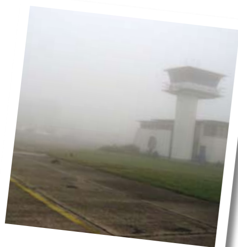
Nebel in Stendal Bis zum Mittag ging nichts