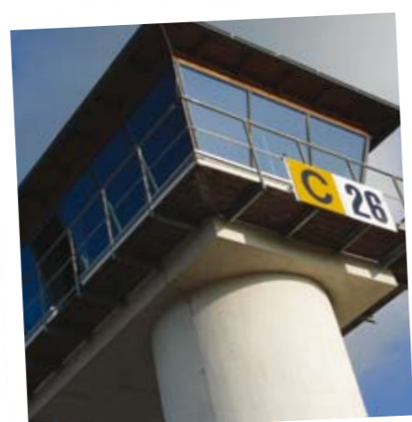
Hier der Tower auch mal ohne Nebel